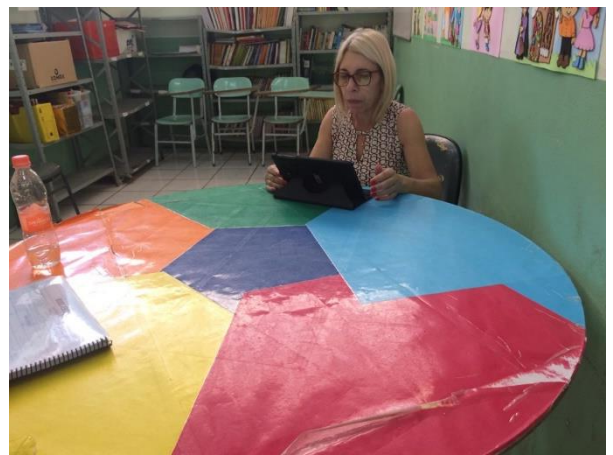
Escola EMEF Carolina Macedo