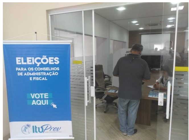
Companhia Ituana de Saneamento - CIS