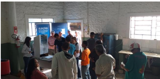
Sub-Prefeitura Regional da Zona Leste