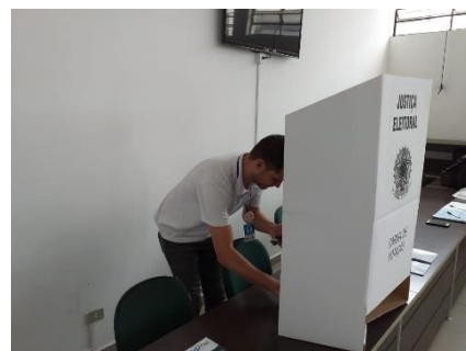
Sub-Prefeitura do Pirapitingui